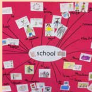
Beeldweb in plaats van woordweb