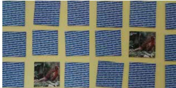
Afbeeldingen zijn in te zetten op diverse manieren. Memory, labelen, geheugenspelletjes etc.