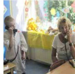
Veilige omgeving en doe-opdrachten