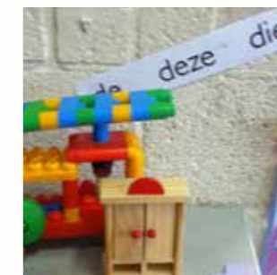
Expliciet aanwijswoorden aanleren